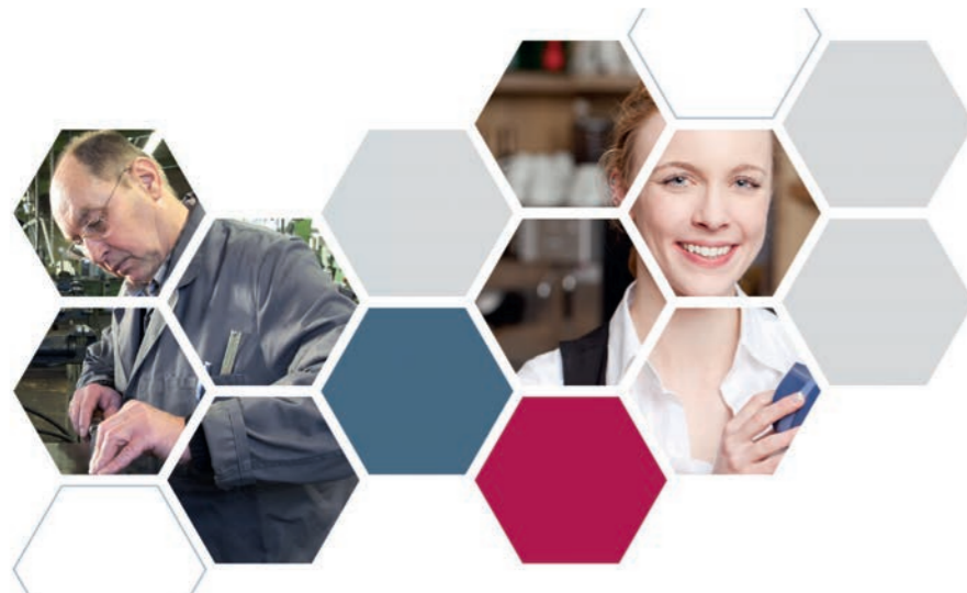
Teilqualifizierung: Schritt für Schritt Kompetenzen erwerben

Mittlerweile existiert eine Vielzahl an Teilqualifikationen in gewerblich-technischen Berufsbildern (z. B. Mechatroniker) sowie kaufmännischen Berufsbildern (z. B. Kaufmann im Einzelhandel). Teilqualifikationen sind ein Instrument vorausschauender Personalentwicklung. Auf Basis anerkannter und zertifizierter Berufsqualifikationen werden vielfältige Karrierewege eröffnet.