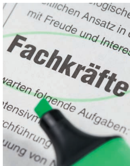
Fachkräfte gesucht: Teilqualifikation hilft

Teilqualifikationen leisten einen Beitrag, Passungsprobleme am Arbeitsmarkt zu lösen. Bei der Qualifizierung von Personen ganz ohne oder ohne eine verwertbare Berufsausbildung profitieren Geringqua-