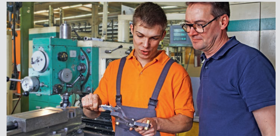
Nachqualifizierung: Auch die Betriebe profitieren

Unsere bisherigen Integrationserfolge belegen eindeutig die verbesserten Beschäftigungsmöglichkeiten für Geringqualifizierte. So nahmen beispielsweise am Standort Nürnberg nach Abschluss des dritten Mo-