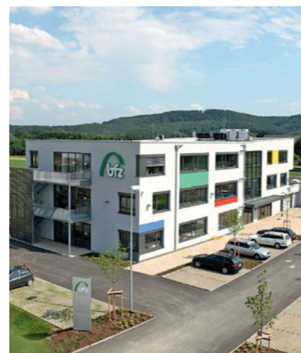
Bildungsinvestition: Neubau Coburg

flexibel nutzbaren Werkstätten beste Lernbedingungen bietet. Das gilt ebenso für den Neubau des bfz Traunstein, der über Seminar- und Praxisräume mit modernster Ausstattung verfügt. Betriebsnahe Qualifizierungen lassen sich jetzt unter einem Dach noch besser durchführen. Ein stimulierendes Lernambiente zeichnet auch das neue Schulungszentrum des bfz Coburg aus, das zudem Veranstaltungen mit bis zu 120 Teilnehmern zulässt. Diese drei Neubauten verbessern die praktischen Qualifizierungsbedingungen in den jeweiligen Regionen deutlich. „Bestens angelegtes Geld“ für die „unendlich wichtige Arbeit des bfz“, lobte Bayerns Wirtschaftsminister Martin Zeil die öffentliche Förderung. ■