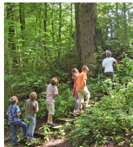
Betreute Ferien: Sport, Spiel, Spannung

Wohin mit den Kindern in den Schulferien, wenn beide Elternteile berufstätig sind? Mit ihrem erlebnisreichen Betreuungs-Konzept „Forscherferien“ überzeugte die gfi Nürnberg/Erlangen die Stadt Nürnberg: Unter ihrer Trägerschaft realisierte die gfi 2010 das Pilotprojekt für 250 Kinder; auch hat sie die Ausschreibungen für 2011 gewonnen. In enger Anlehnung an den Grundschullehrplan, aber ohne aus den Ferien eine verlängerte Schulzeit zu machen, entwickeln die Kinder spielerisch ihr Weltverständnis – etwa indem sie Heimatforschung betreiben, sich in die Zeit der Ritter versetzen oder ergründen, was es mit dem Strom auf sich hat. ■