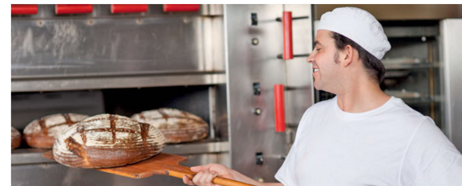
Umschulung im Betrieb: bfz Traunstein hilft mit

Das bfz Traunstein wird ab September in Zusammenarbeit mit der Arbeitsagentur innerbetriebliche Umschulungen zur Ausbildung Geringqualifizierter begleiten. Über das Angebot, einen anerkannten Berufsabschluss zu erwerben, wurde bereits im Mai informiert.