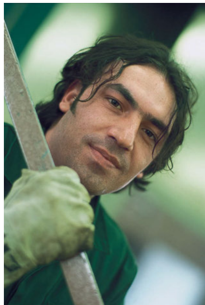
Neue Perspektiven: Berufsabschluss

Entgegen dem europäischen Trend ist die Arbeitslosigkeit mit der Finanz- und Wirtschaftskrise in Deutschland nicht gestiegen – im Gegenteil. Bayern nähert sich der Vollbeschäftigung. Die Kehrseite der erfreulichen Entwicklung: Dem Arbeitsmarkt gehen die Fachkräfte aus. Währenddessen beschäftigen Unternehmen an- und ungelernete Mitarbeiter, deren Perspektiven eher düster sind. Manche von ihnen haben zwar