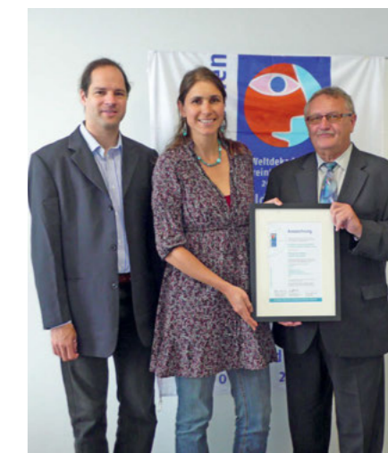
Erfreut über Anerkennung: bfz-Team

Bereits mehr als 200 Mitarbeiter setzen den Gedanken des globalen Lernens in kreativen Projekten um, regionale Mitarbeiterpools und deren kontinuierliche Weiterbildung gewährleisten seine Integration in Bildungsangeboten als dauerhafte Aufgabe. ■