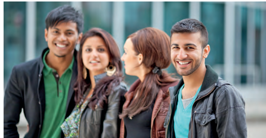
Berufliche Eingliederung: Erfolg im Job

„Berufsbezogene Deutschkurse“ wenden sich an Migranten, die in der Regel bereits einen Integrationskurs besucht haben und damit mindestens über Grundkenntnisse in der deutschen Sprache verfügen. Für eine dauerhafte Arbeitsaufnahme fehlen ihnen jedoch erfahrungsgemäß berufsbezogene Deutschkenntnisse. Die Zielgruppe sind damit insbesondere Bezieher von Arbeitslosengeld I bzw. II. Auch Arbeitnehmer, die zum Erhalt ihres Arbeitsplatzes ihre berufsbezogenen Sprachkenntnisse verbessern möchten, können das Angebot nutzen. Ent-