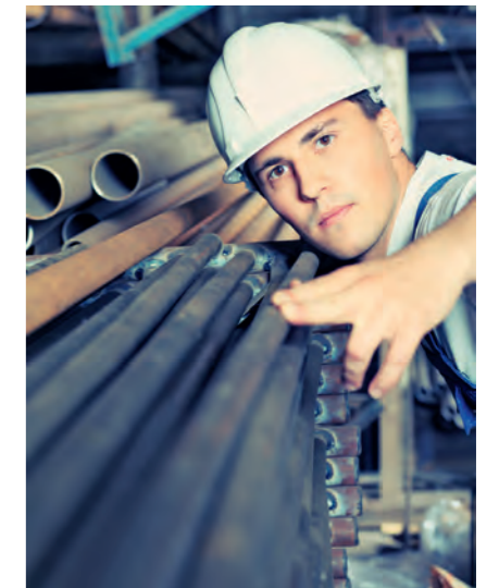
„Neue Offenheit“: Fachkräfte aus Osteuropa

Matching mit den Stellengesuchen der Mitgliedsunternehmen von bayme vbm. Im Idealfall wird im Anschluss der direkte Kontakt zwischen Bewerber und Unternehmen hergestellt. Im Fall der Einstellung gibt