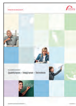
Cover Geschäftsbericht 2010

Über die bbw-Unternehmensgruppe und ihr Leistungsprofil informiert umfassend der neue Geschäftsbericht. Mit ausführlichen Projektdarstellungen, Erläuterungen zu neuen Geschäftsfeldern und Kompetenzzentren oder Informationen zum Ausbau der Fachschulen bietet der Bericht eine aktuelle Bestandsaufnahme. Ein Schwerpunkt sind Projekte zum Thema Frauen in der Arbeitswelt und zur Vereinbarkeit von Familie und Beruf (Download: www.bbw.de ). ■