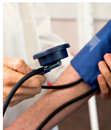
Krankenpflegehilfe: Erlernbar in Bayreuth

Passbilder, Urlaubsfotos, Schnappschüsse anlässlich irgendwelcher Feiern – hier hinterlässt der Normalbürger für gewöhnlich sein Konterfei. Vom Profi-Lichtbildner produzierte Aufnahmen des eigenen Gesichts haben die wenigsten vorzuzeigen. Aber wer sähe sich nicht gern vorteilhaft abgelichtet und gerahmt an einem Ort stehen, wo er lieben Menschen in den Blick fällt? Der ame-